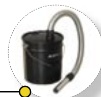
Контейнер для пыли